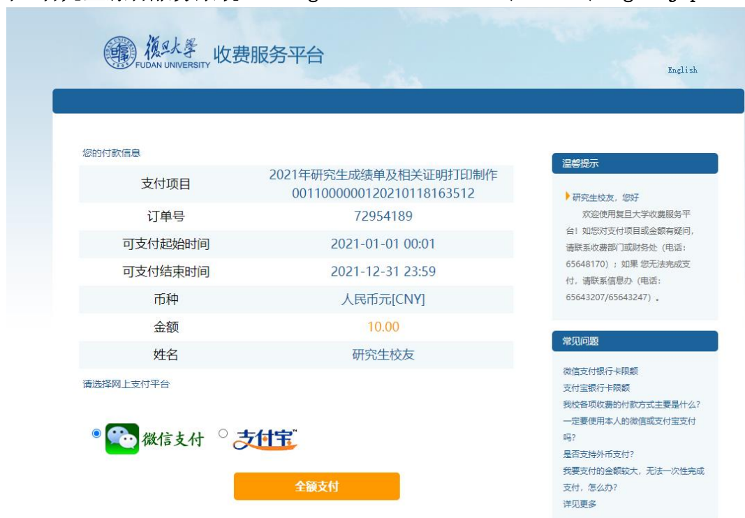
图 4 研究生综合管理系统

在校生可在研究生院官网首页的“研究生综合服务系统”申请缴费。进入“自助打印”，“预约申请”后选择相应项目申请并缴费，系统支持“微信支付”和“支付宝”。