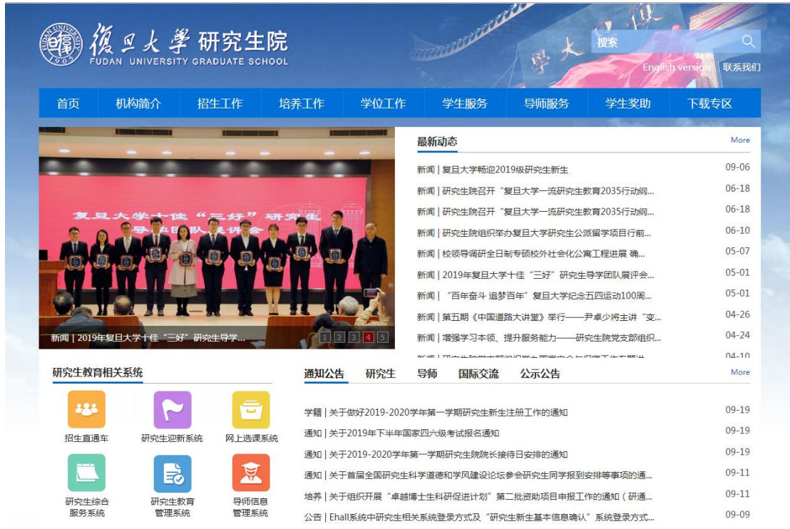
图 1 研究生院主页

研究生院网站在“通知公告”等栏目中发布各类通知信息。左侧有研究生教育相关系统链接。“下载专区”包含各类表格下载。