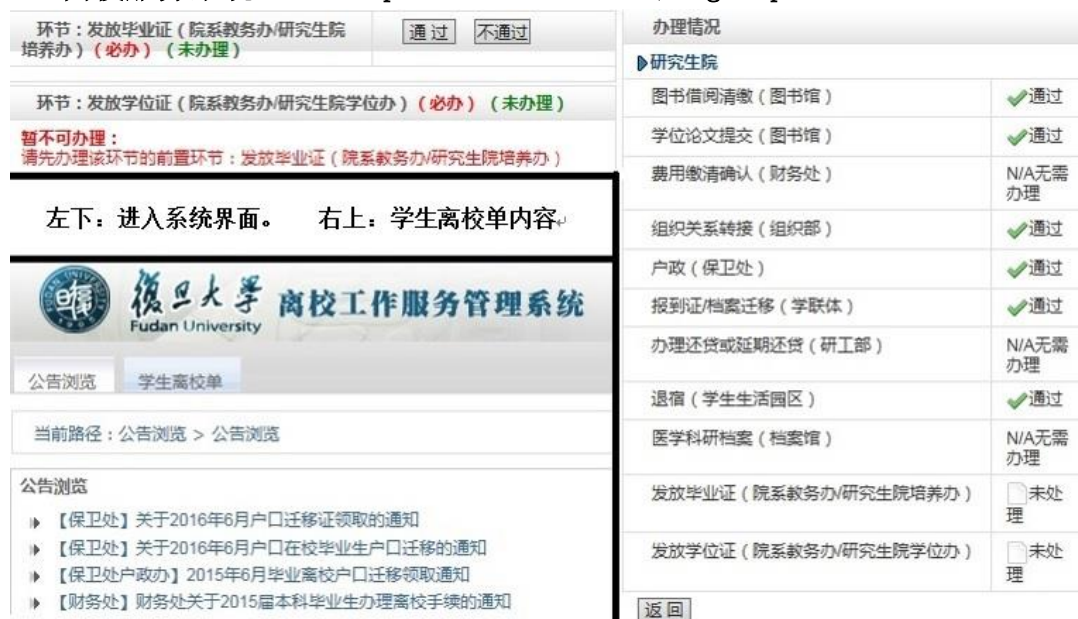
图 5 离校服务系统

离校服务系统是毕业生离校网上服务平台。“公告浏览”发布离校相关通知,“学生离校单”显示离校前须办理各项业务。在“发放毕业证”和“发放学位证”两个环节部分,显示“通过”表示可以办理领证,显示“暂不可办理”提示需要完成的前置环节。